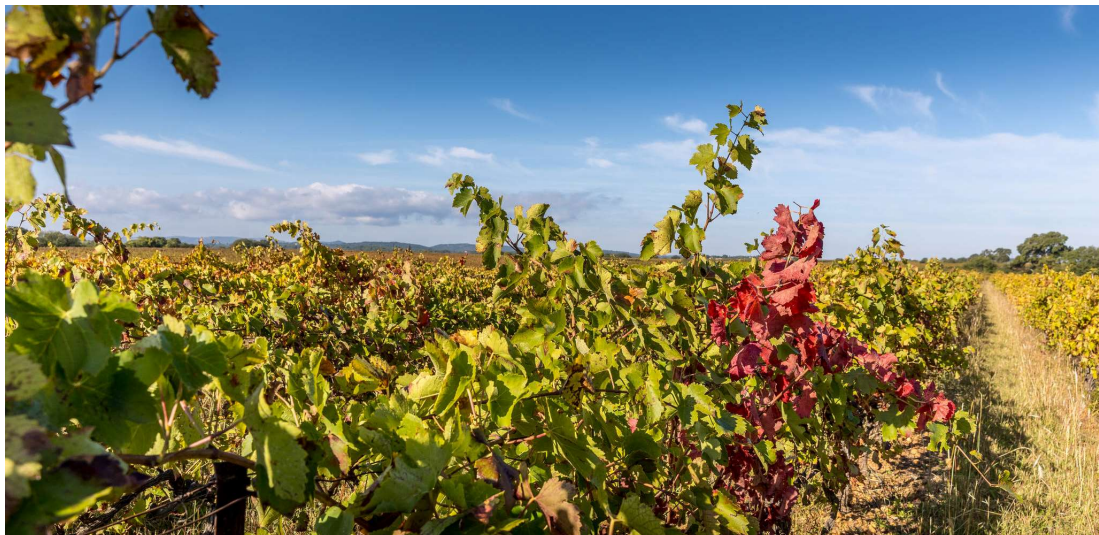
Paysage de vignoble au Château de Fourques, à Juvignac, au cœur de la métropole.

Montpellier Méditerranée Métropole abrite sur son territoire une richesse viticole à laquelle aucune autre métropole française ne peut prétendre : avec 200 vigneron sur près de 3 000 hectares, le vignoble est aux portes de Montpellier, traçant un lien intime entre la ville et la campagne. La Métropole occupe également une position de carrefour stratégique, au cœur du plus grand vignoble de France, le Languedoc, en plein essor. A cela s'ajoute un écosystème dynamique, porté par des instituts de recherche, de formation et une filière de la gastronomie et de l'hôtellerie de premier plan. Autant d'atouts permettant d'asseoir une démarche ambitieuse pour positionner la métropole de Montpellier comme capitale du vin.