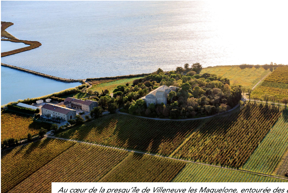
Au cœur de la presqu'île de Villeneuve les Maguelone, entourée des étangs du bord de mer, la vigne s'épanouit depuis des siècles dans un lieu réservoir de biodiversité

Montpellier Méditerranée Métropole a été la 1 ère métropole de l'Hexagone à s'engager en faveur d'une politique agroécologique et alimentaire collaborative. La Métropole porte ces mêmes orientations pour la filière vin, afin de mettre en adéquation les pratiques viticoles, les enjeux environnementaux et les nouvelles attentes des consommateurs.