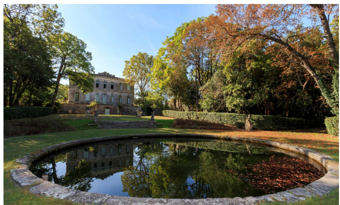
Château de l'Engarran sur la commune de Lavérune

Plusieurs de ces magnifiques demeures hébergent des propriétés viticoles historiques (Château de l'Engarran, fondé en 1632, Château de Flaugergues, depuis 1696, Domaine de Rieucoulon, depuis 1676), qui ouvrent les portes de leurs caveaux, avec de nombreux événements œnologiques organisés toute l'année.